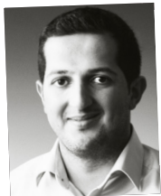
Halat Tunc JAV VW Emden