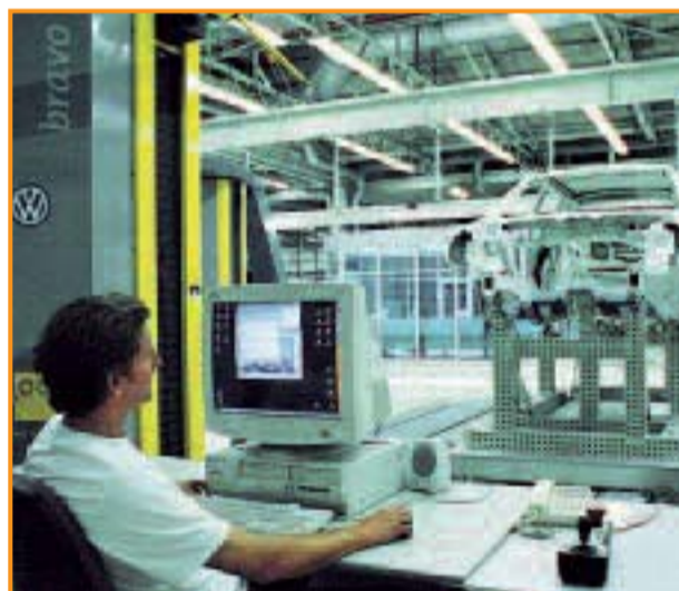
Ob Puebla, Palmela, Pacheco, Pamplona oder Wolfsburg – die Probleme sind gleich, nur die Sprache unterscheidet sich.