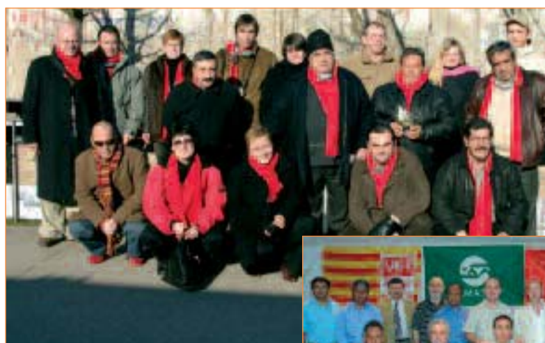
Die internationale Kooperation wächst: Besuch der spanischen Delegation (Foto oben), Abschluss der Vereinbarung zum deutsch-iberoamerikanischen Netzwerk.

Es ist mittlerweile schon liebevolle Tradition: Die Kooperation der IG Metall Wolfsburg mit den spanischen Gewerkschaften MCA-UGT und FM-CCOO aus der katalanischen Region Baix-Llobregat. Im Februar ist erneut eine spanische Delegation zu Gesprächen in Wolfsburg gewesen.