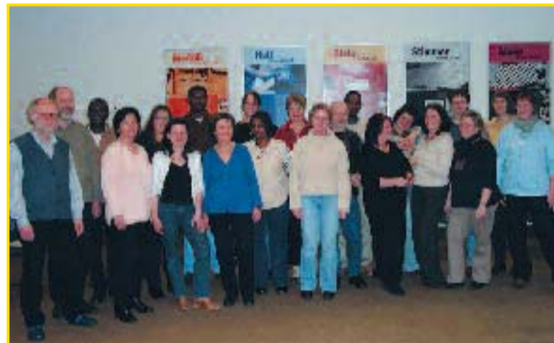
Der Gewerkschaftschor „Gegenwind“ gibt zwei Solidaritätskonzerte.

IG Metall-Verwaltungsstelle, Postfach 100455, 38 404 Wolfsburg Tel.: 05361/200242 Verantwortlich: Wolfgang Schulz, Frank Patta, Michael Semenow Redaktion: Willi Dörr Grafik: Ulili Scholz Druck: IF Publication Service Versand: MediaKom Verlag GmbH Der Bezugspreis ist im Mitgliedsbeitrag enthalten. Erscheinungsweise: 9 x pro Jahr Nächste Ausgabe: 18. März 2005